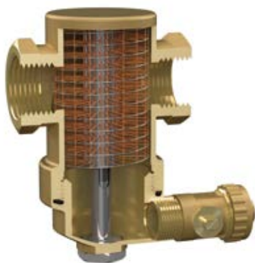
Exdirt laiton, séparation de particules et de boues, horizontale